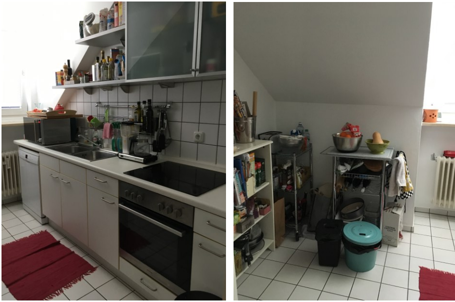
Küche mit Küchenzeile (ohne Spülmaschine und ohne Kühlschrank)